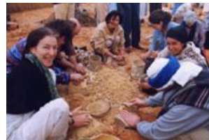
Une formation adaptée à tous les environnements professionnels et citoyens

Ce stage propose une sensibilisation aux différentes postures fondamentales de la Communication NonViolente, que nous retrouvons dans un certain nombre d'approches innovantes de management :